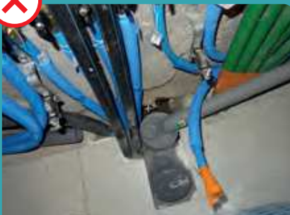
Passage de réseau dans le sol